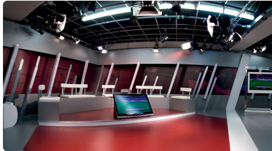
Plató principal de Barça TV