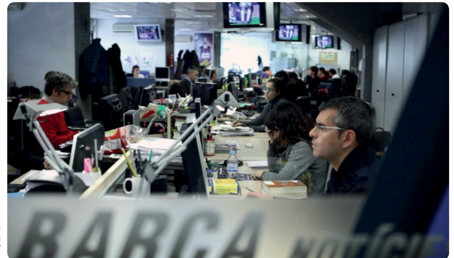
Sala de redacción en Barça TV