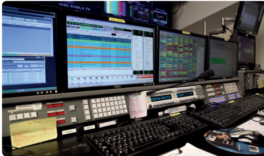
VSNMULTICOM gestiona la automatización de la continuidad en Barça TV