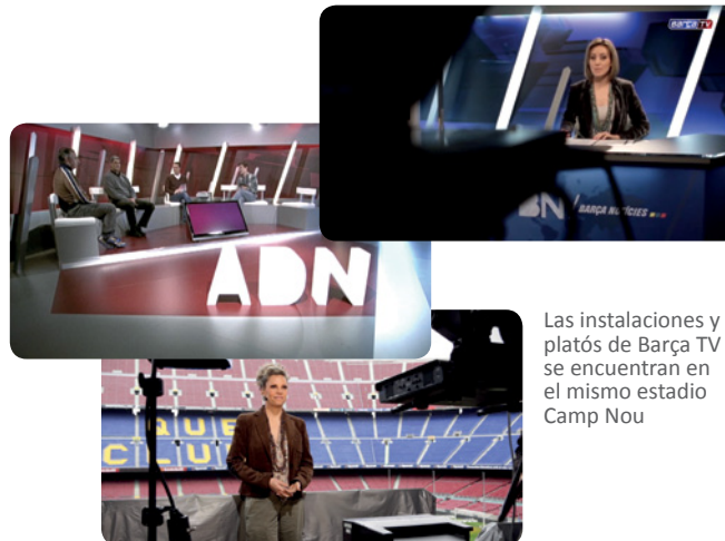
Las instalaciones y platós de Barça TV se encuentran en el mismo estadio Camp Nou